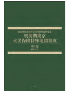
※書影はシリーズ既刊のものです。

建物や住宅を一軒一軒訪問して作製された火災保険特殊地図(火保図)は、居住者名や建物名称、地番のほか、建物概形や階高、構造、塀の材質、消火栓の位置や道路の幅員までを克明に記録した唯一無二の大縮尺地図である。変貌を遂げつづける大都市・東京の戦前からの歴史の変遷が読み取れ、街並みの精確かつ立体的な復元を可能にする第一級の歴史資料を90年の時を経てついに復刻。約1500葉の原図を原寸のまま全27巻に収録。