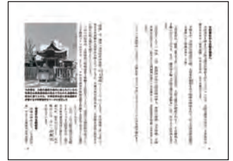
※ページ見本は変更の可能性があります。ご了承ください。

大阪天満宮のご祭神は菅原道真だが、大阪天満宮が創祀される約250年前、同地に大將軍社が鎮座した。大將軍神は星辰信仰で、「天満」は満天の無数の星を意味し、天満天神はそれを受け継いで生まれた神号だった。あるいは鉾流神事はケガレを海に流すために始まったなど、大阪天満宮と天神祭の歴史をひもとき、また江戸時代の天神祭がどのようなものであったのかを当時の錦絵から読み解くなど、興味深い話題満載の書。