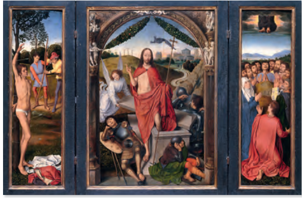
『キリストの復活』 1490年ごろ、板に油絵、62×44.5cm（枠内）74×81cm、185cm（全高）×119cm、ドイツ・メミンゲン、1490