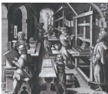
▶16世紀末ヨーロッパの印刷所。左奥が校正者