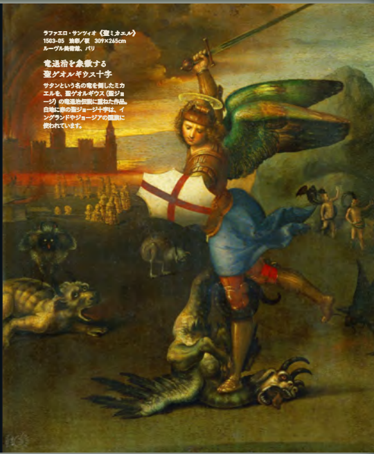
ラファエロ・サンティ 《聖ミカエル》 1518年 油彩/木 307x145cm ルーヴル美術館、パリ

電通電を象徴する 聖ミカエルが十字架 を手にする姿を模したミカ エルを、聖ミカエルが、聖ミ カエルの聖像を模した作品 は、19世紀後半から20世紀 前半にかけてヨーロッパの グラフィックデザインの領域に 使われていた。