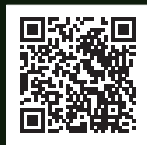
山田五郎 オトナの教養講座

1958年、東京都生まれ。編集者・評論家。東京国立博物館評議員。AHS（英国古時計協会）会員。上智大学文学部在学中にオーストリア・ザルツブルグ大学に1年間遊学し、西洋美術史を学ぶ。卒業後、講談社に入社。「Hot-Dog PRESS」編集長、総合編集局担当部長等を経てフリーに。現在は時計、西洋美術、街づくりなど幅広い分野で講演、執筆活動を続けている。「ぶらぶら美術・博物館」(BS日テレ)、「出役! アド街ッ天国」(テレビ東京)など、テレビ・ラジオの出演も多い。主な著書に「知識ゼロからの西洋絵画入門」「知識ゼロからの西洋絵画史入門」「知識ゼロからの西洋絵画 困った巨匠対決」「知識ゼロからの近代絵画入門」(以上、幻冬舎)、「ヘンタイ美術館」(共著・ダイヤモンド社)、「へんな西洋絵画」(講談社)など。