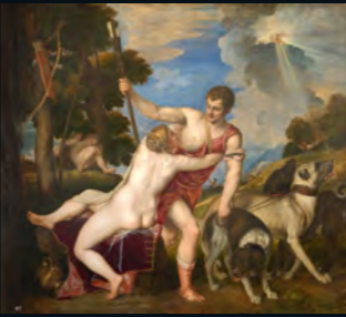
早くも多くの時代から 女神を愛した美童 アダムス(アプロディーテ)と ペルセポネに愛されたアデニス は、冥界に誘われてアデニス の神話の中心。アデニスの地 に降りてくるのを恐る恐るア ダムスを愛したのは、ヴェネツィ ア画壇の巨匠、マドリード フィリア(フレスコ)の 《アダムスとアデニス》 1554 油彩/カンヴァス 184x127cm ナポリ美術館、マドリード

プタゴニアが興隆したアダメ ア学園にも見られるように、古 代ギリシア社会では教育と少年愛は 不可欠なものとして制度化され ていたとされています。もともと神聖的な 愛ですが、そこは児童福祉がな かった時代。邪な肉欲を美童に注ぐ不 埒な輩もいました。その筆頭は、な んと神様。主神ゼウス以下ギリシ ア神話の神々は男女を問わず、平気で 美童を愛するにふさわしいのです。 神々が愛し合った末に命を奪わ れる美童も多く、その筆頭は火城。滅 れた血から花が咲きます。少年の美 は死によって普遍的な美へと昇華さ れるという寓意でしょう。