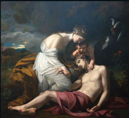
ペネロペ(ペネロペ) 《アダムスの死》(アデニス) 1719 油彩/カンヴァス 142.4x174.5cm カーネギー美術館、ピッツバーグ